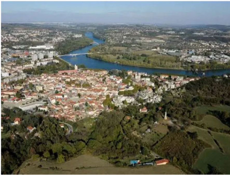
Givors - vue générale