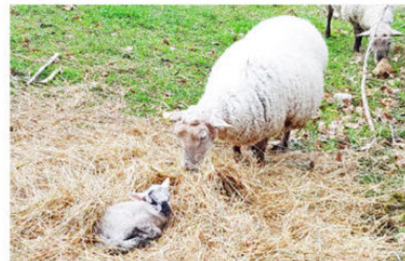
Moutons aux abords du sentier

En bas, suivre la route à gauche pour revenir au point de départ du circuit.