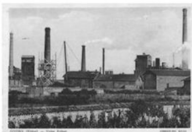
Les usines Prénat (photo de droite) et Fives-Lille