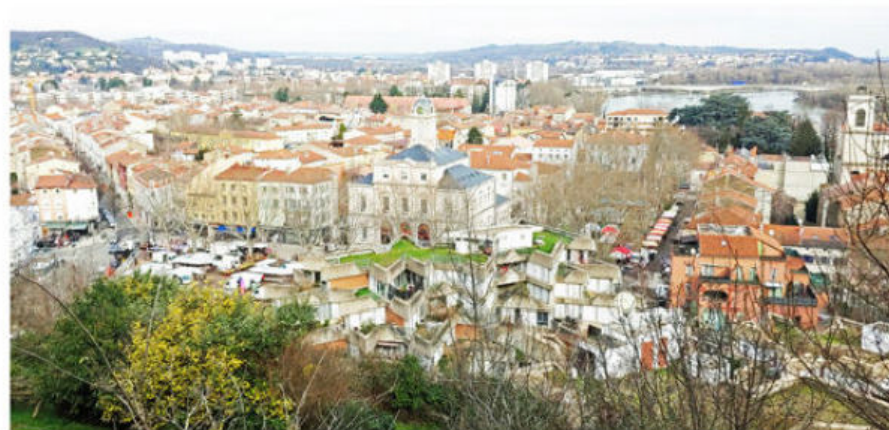
Vue sur Givors depuis le sentier