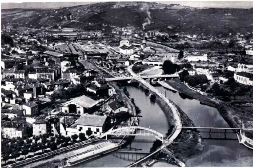
Givors vers 1950, avec, au centre, la cheminée.